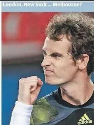
London, New York ... Melbourne?

"There is huge potential in the UK. It is important we have the spirit of confidence. Some of the mistakes from Threadneedle Street are not the stuff to give the troops." He added: "We need investment in housing and transport,